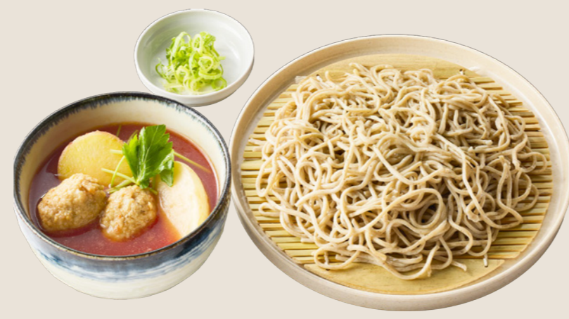
とりつくねと素揚げ野菜の トマトつけ汁そば ¥990