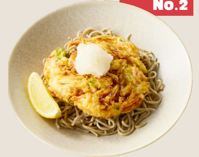
レモンおろしのかきあげそば ¥990