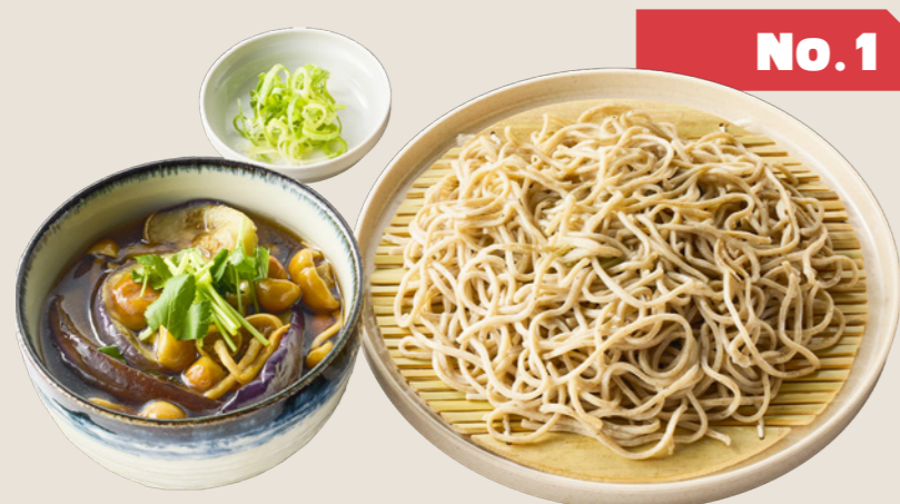
揚げなすと 「株とりなめこ」のつけ汁そば ¥880