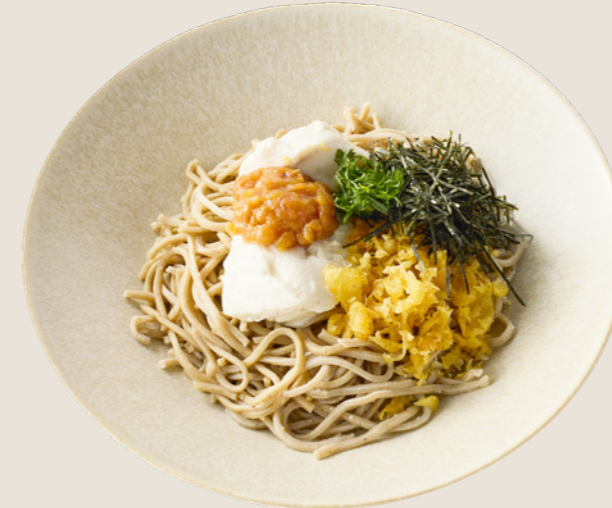
自家製とうふと南高梅のそば ¥880