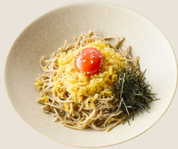
FUTATSUの冷やしたぬきそば ¥790