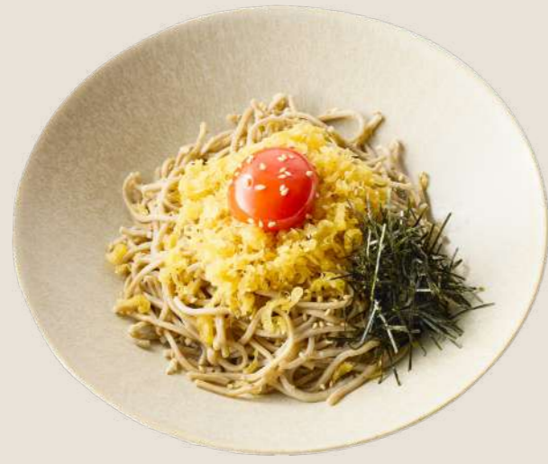
FUTATSUの冷やしたぬきそば ¥790