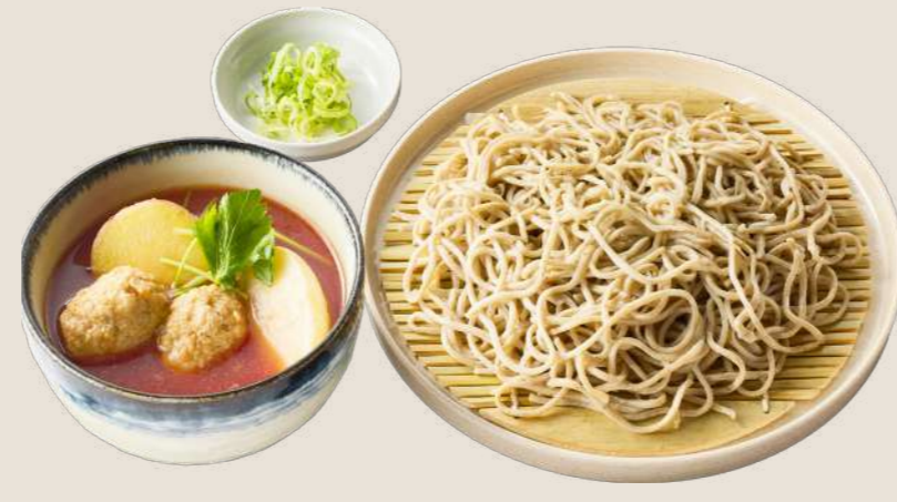
とりつくねと素揚げ野菜の トマトつけ汁そば ¥990