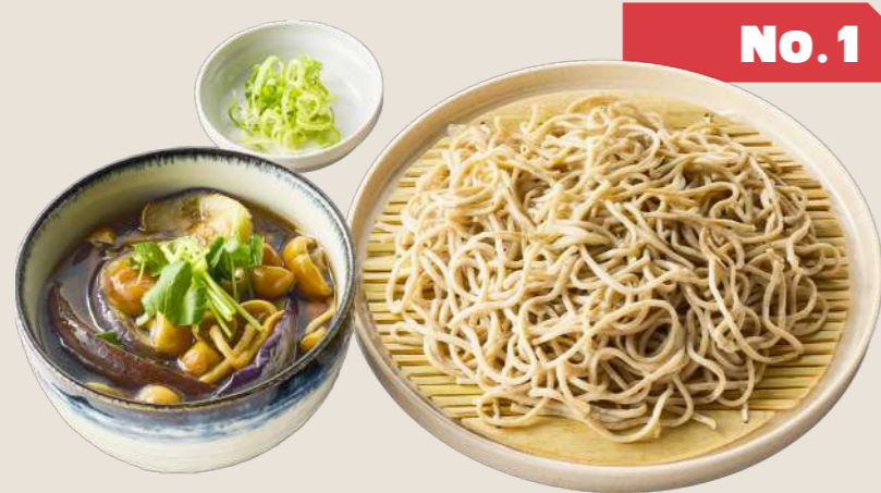
揚げなすと 「株とりなめこ」のつけ汁そば ¥880