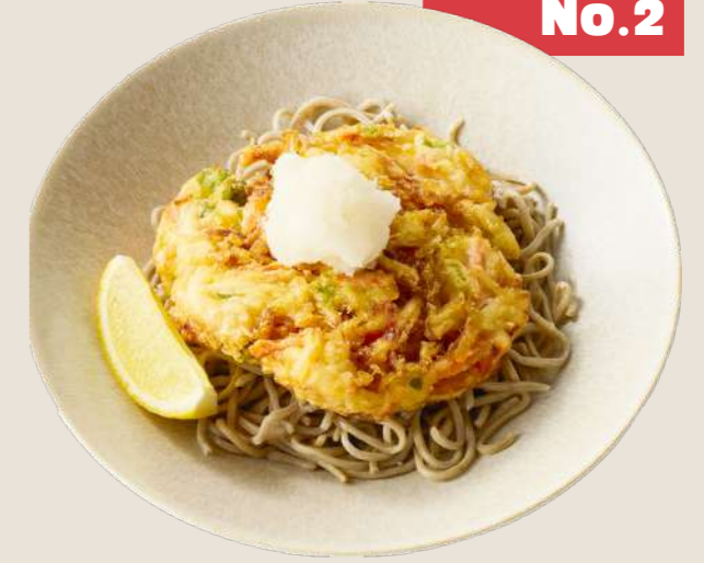
レモンおろしのかきあげそば ¥990