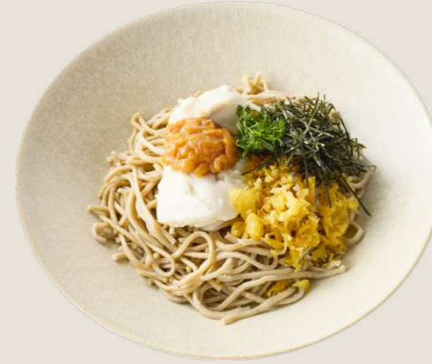
自家製とうふと南高梅のそば ¥880